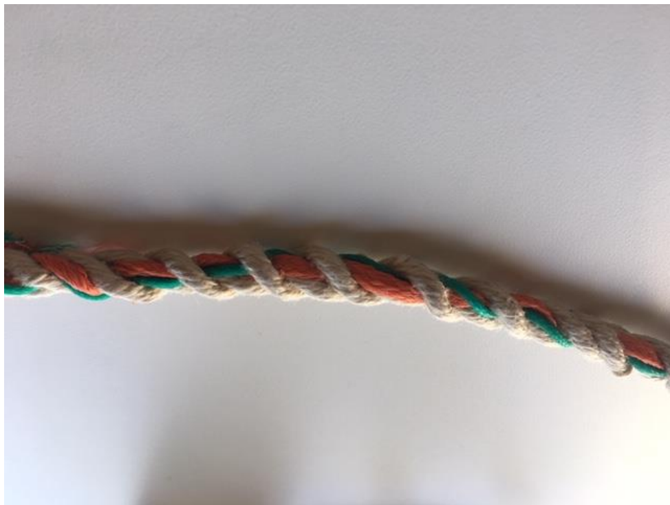
Figure B – Combinaison de couleurs identifiant la région, l'espèce et la zone de pêche La région et l'espèce entrelacés sur le même segment de corde, la zone de pêche sur le segment suivant de la corde. Cette combinaison indique la région du Québec (vert), crabe des neiges (orange), ZPC 12A (vert).

Figure A – Combinaison de couleurs identifiant une région et l'espèce Cette combinaison indique la région du Québec (vert), crabe des neiges (orange) entrelacés sur le même segment de la corde.